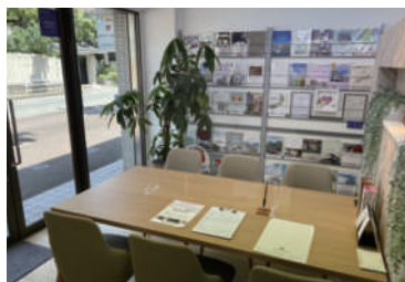
あんすま老人ホーム相談室 西宮北口店 阪急「西宮北口」駅より 徒歩約6分

コロナが5類になって初めての夏。コロナ禍前を思い出しつつある今日この頃です。夏のお祭りや花火大会など人と触れ合うことができる季節です。気をつけながらも楽しい夏にしていきたいですね！