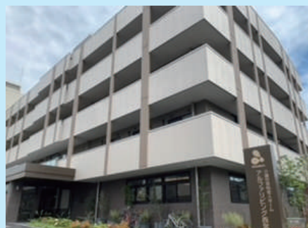
アルファリビング西宮北口

これまでの運営実績を活かし、今回西宮市に誕生したということで大変楽しみにしております。もちろん特徴もたくさんありますが、今回も吟味して3つに絞りお伝えいたします。