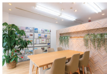
あんすま老人ホーム相談室 西宮北口店 阪急「西宮北口」駅より 徒歩約6分

長いマスク生活がようやく緩和されることになりました。気を抜くにはまだ早いですが今年のお花見は満開の桜の元ノーマスクでにっこり笑顔の記念写真を撮りたいですね！