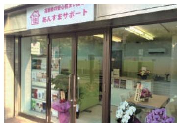
あんすま老人ホーム相談室 西宮北口店 阪急「西宮北口」駅より 徒歩約6分

今回で30回目となるあんすま通信。皆様からのご意見をいただきながら発行し続けることができました。皆様のニーズにあった内容を今後もお届けできればと考えております。地域の皆様の老人ホーム相談窓口として地に足を付け努めて参ります。