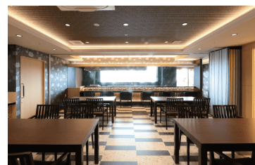
●レストラン桃源郷

通常のホーム食も味にこだわりを持ち提供していますが、当施設は和食・ステーキハウス・グリル中華・カフェといった日々のホーム食以外もお楽しみいただけるよう館内に6つのレストランを設けお食事をご自身で選び、お召し上がりいただくことが可能です。生活と健康の根幹を支え人生を彩るようこだわり抜いた食事を是非お楽しみください。