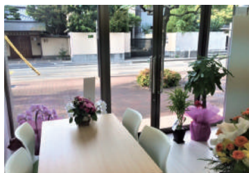
あんすま老人ホーム相談室 西宮北口店 阪急「西宮北口」駅より 徒歩約6分

2021年も残すところ2ヶ月を切りました。年末に向けてお忙しくなる季節です。新型コロナウイルスの影響が幾分落ち着き、少しずつ日常を取り戻しつつありますが、まだ油断せず感染予防を行って参りましょう。来年が良い一年になりますよう、良い年末をお過ごしください！