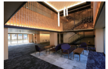
●ラベンダーカフェ

厚生労働省の人員配置基準「3:1」を超える「2:1以上」の介護スタッフを配置した手厚い体制を整えているため、ゆとりあるケアがご提供可能です。手厚い体制により入居者様の趣味や支援に向き合える時間が確保できます。また8:30~17:30は看護師が常駐し、バイタルチェックや服薬管理など、入居者様の健康管理を行っています。