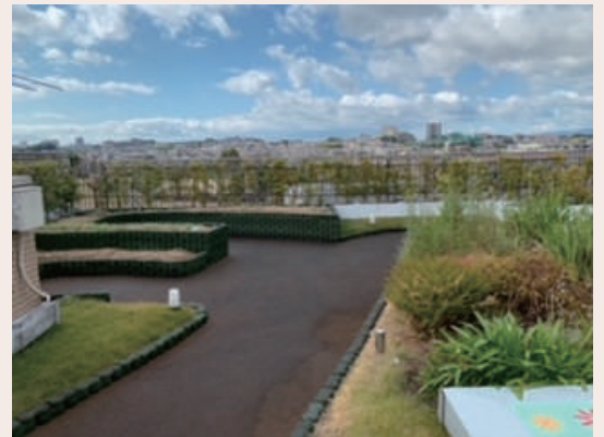
エイジフリーライフ星ヶ丘