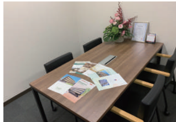
あんすま老人ホーム相談室 大阪梅田店 阪急「大阪梅田」駅より 徒歩約8分