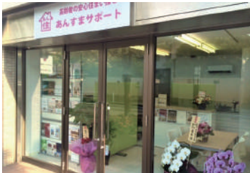
あんすま老人ホーム相談室 西宮北口店 阪急「西宮北口」駅より 徒歩約6分

8月はオリンピックとパラリンピック一方コロナ感染拡大やお盆の長雨と例年になく8月となりました。ワクチン接種が行き届いてない中、不安もあるかと思えます。自分の身は自分で守ることが大切です。引き続きマスク着用など感染予防を継続しコロナに打ち勝ちましょう。