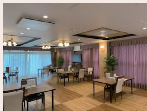
SOMPOケアラヴィーレ池田

自立の方でしたので、お買い物やお出かけの際にご利用される交通機関を考慮して、ご希望に沿った施設をご提案いたしました。5施設ご見学いただき、その中から条件に合った施設にご入居されました。