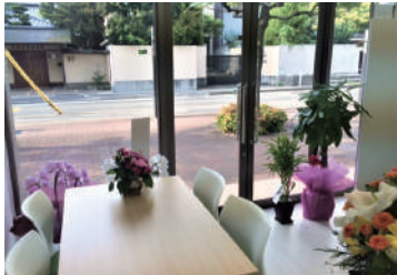
あんすま老人ホーム相談室 西宮北口店 阪急「西宮北口」駅より 徒歩約6分

体調管理が重要な季節になりました。今年の冬はインフルエンザとコロナウイルスの両方が混在する今までにない冬になります。マスク・うがい・手洗いに加え、睡眠も大切です。元気に良い年末を迎えましょう。