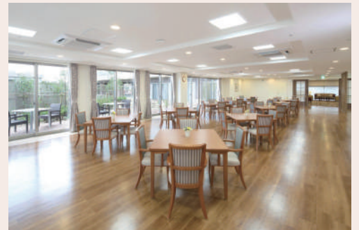
グランダ門戸厄神

40歳以上65歳未満の医療保険（健保組合、全国健康保険協会、市町村国保等）の加入者