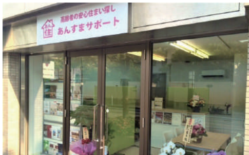
あんすま老人ホーム相談室 西宮北口店 阪急「西宮北口」駅より徒歩約6分

今年の夏も例年に負けず暑い日が続きました。熱中症対策に加えマスク着用やソーシャルディスタンスを保つコロナ対策など厳しい夏でした。でも爽やかな秋はもうすぐ。残暑を乗り越えコロナも克服しましょう！