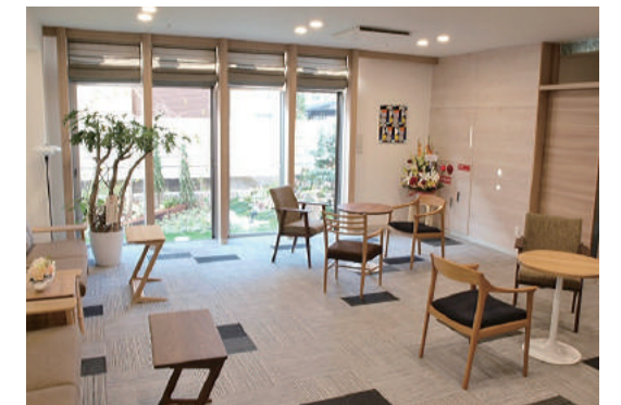
●エントランスホール

ご入居可能な方は幅広くお元気な自立の方から介護が必要な要介護5の方までご入居が可能です。昨今介護度の低い方、特に自立の方や要支援の方がご入居できない施設が多い中、当施設様は幅広い方にご入居いただけます。皆様のお体の状態にあわせた丁寧な対応を心がけています。