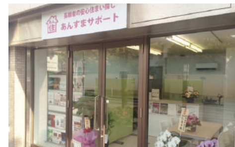
あんすま老人ホーム相談室 西宮北口店

「内容も益々充実してきて、とても楽しみにしているよ」とご丁寧にご連絡をいただき、身の引き締まる思いです。本当にありがとうございます。少しでも皆様のご参考になればという思いでお届けしています。