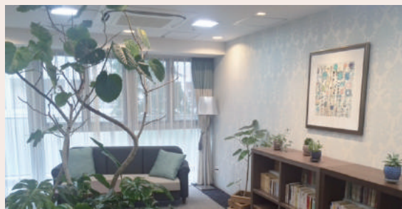
チャーム西宮用海町

訪問診療の内容や協力医療機関への病院送迎、緊急時のスタッフ対応などを施設に確認しましょう。